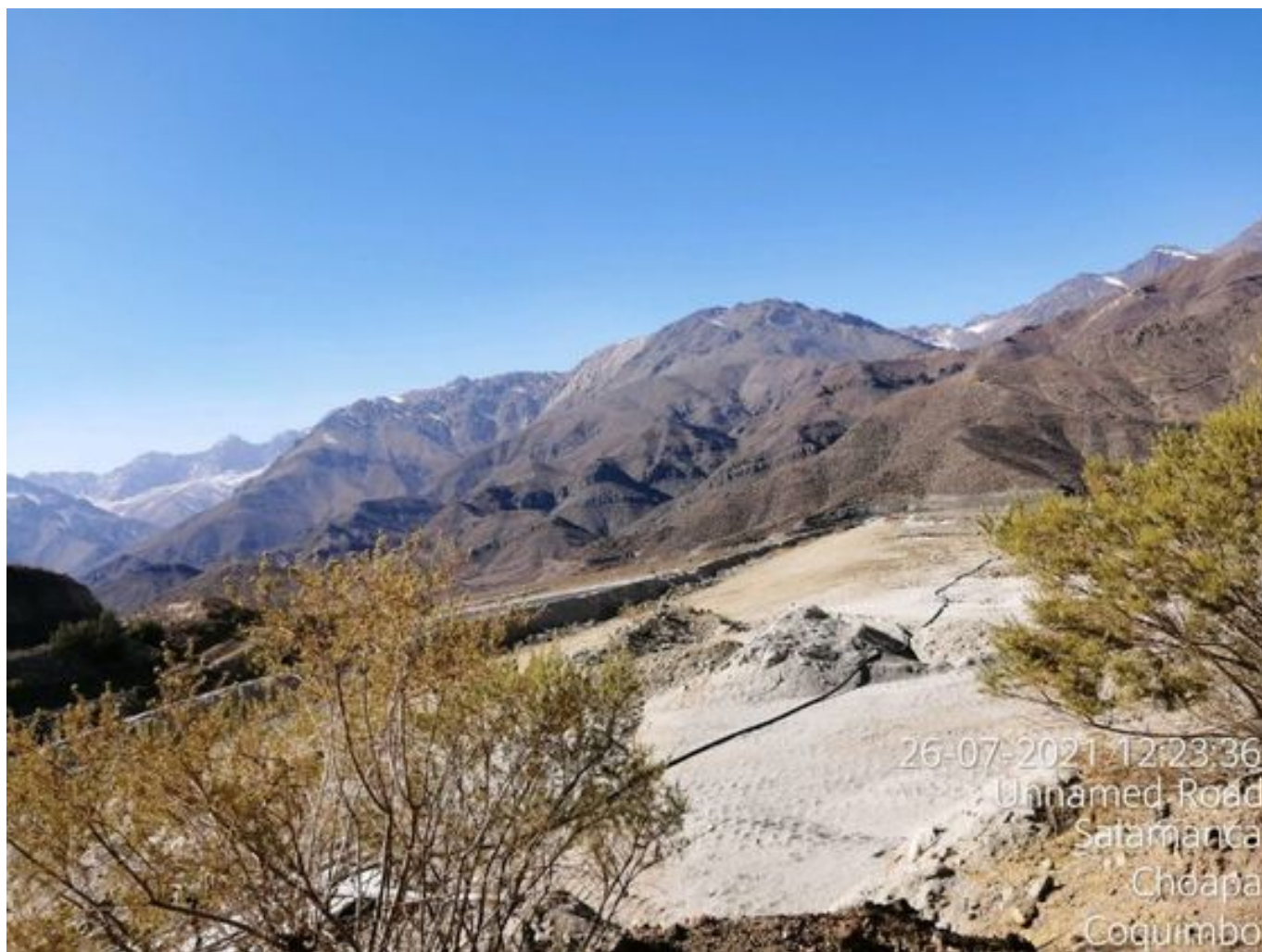
Foto 35: Medida: Aplicación Soiltiac coronamiento del muro. Lugar: Tranque Quillayes. Comentarios: No se observan trabajos en el área.