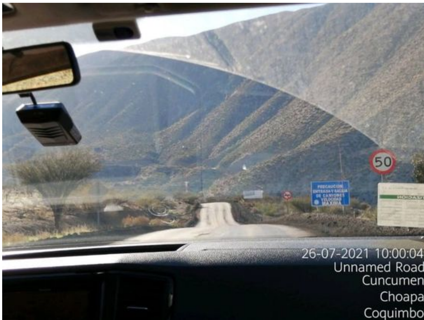
Foto 30: Medida: Aplicación Dust Control. Lugar: Portones a Chacay. Comentarios: Se observa camino con aplicación de producto entre cortado operativo.