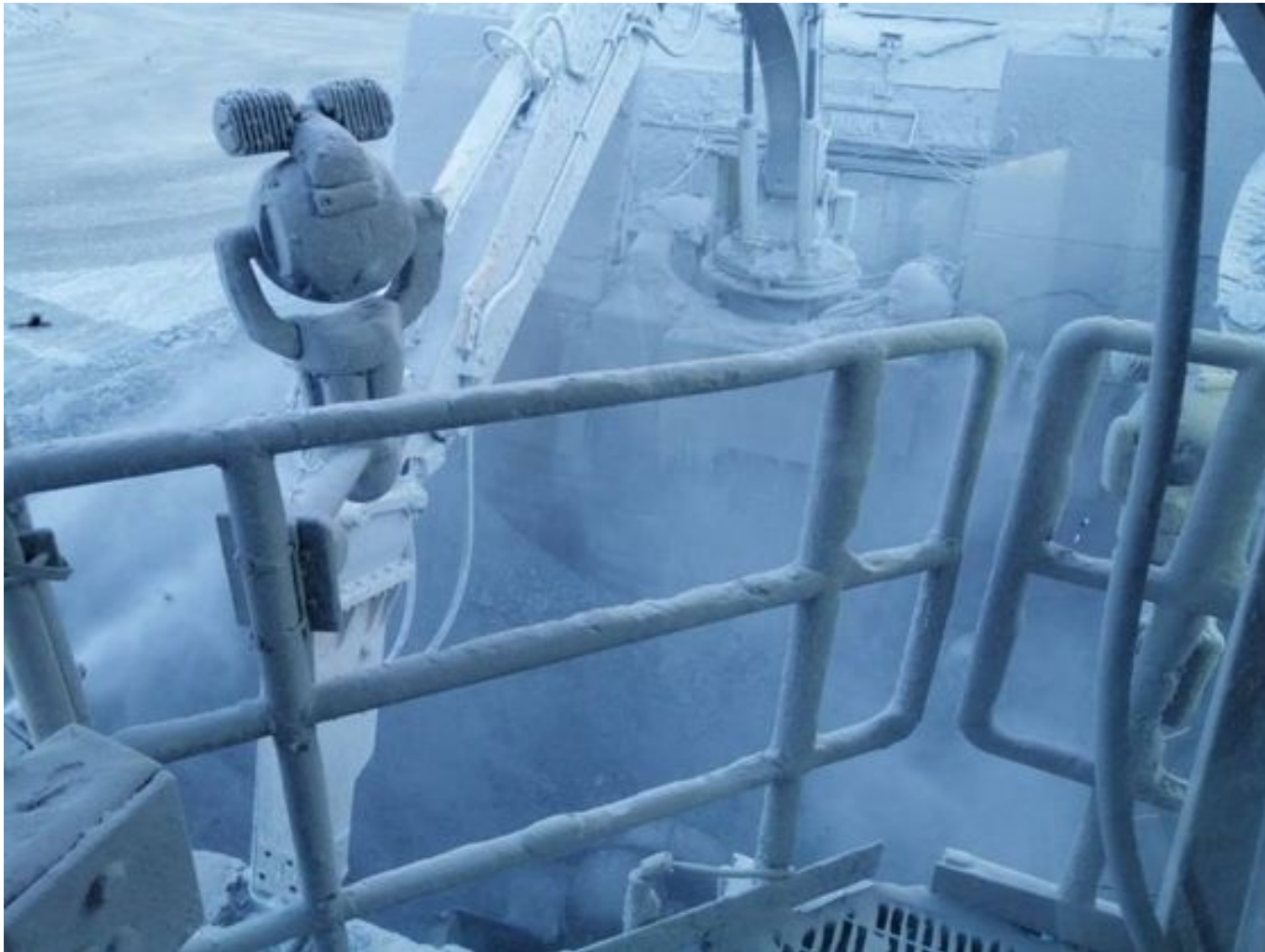
Foto 18: Medida: Supresor de polvo. Lugar: Taza Chancado 1. Comentarios: Supresores de polvo operativos, medida insuficiente para mitigar material particulado en suspensión. TK: 4.160L. Bombas al 20% ambos chancados.