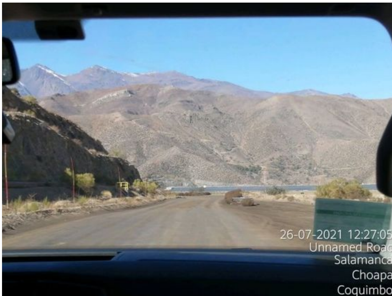
Foto 22: Medida: Aplicación Dust Control camino alternativo. Lugar: Estribo derecho Tranque Quillayes. Comentarios: Se observan caminos con aplicación de producto entre cortado operativo.