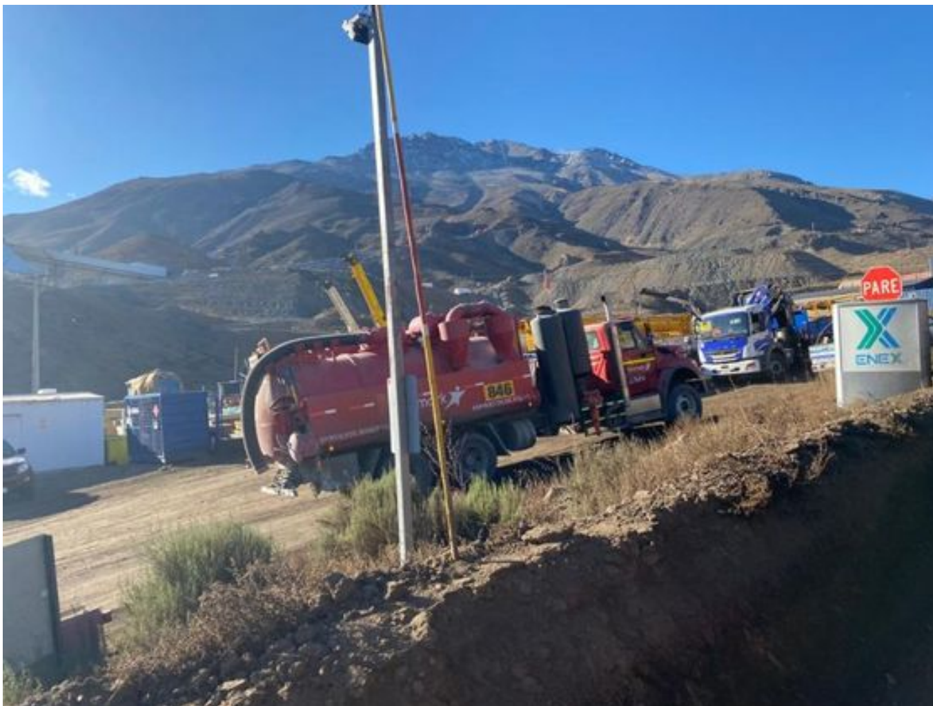
Foto 12: Medida: Limpieza con camión super sucker. Lugar: Chancado y correas. Comentarios: Camión super sucker operativo, visto en dirección a tp2.