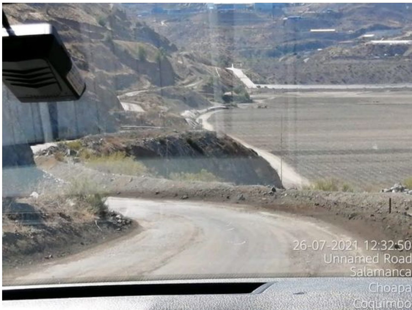
Foto 23: Medida: Aplicación Dust Control camino alternativo. Lugar: Estribo derecho Tranque Quillayes. Comentarios: Se observan caminos con aplicación de producto entre cortado operativo.