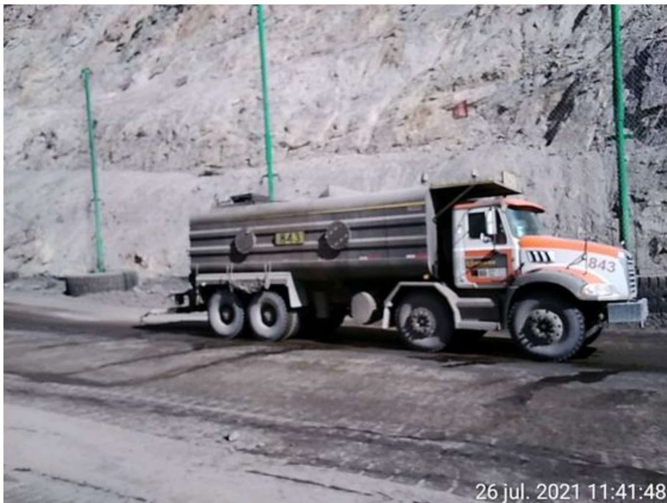
Foto 10: Medida: Aplicación anticongelante. Lugar: Caminos Interior Mina. Comentarios: Producto anticongelante y camión salero operativo.