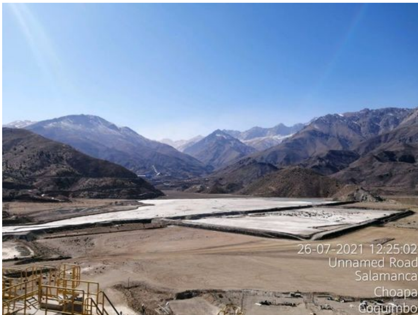
Foto 34: Medida: Aplicación de empréstito. Lugar: Sector Tranque. Comentarios: No se observan trabajos en el área.