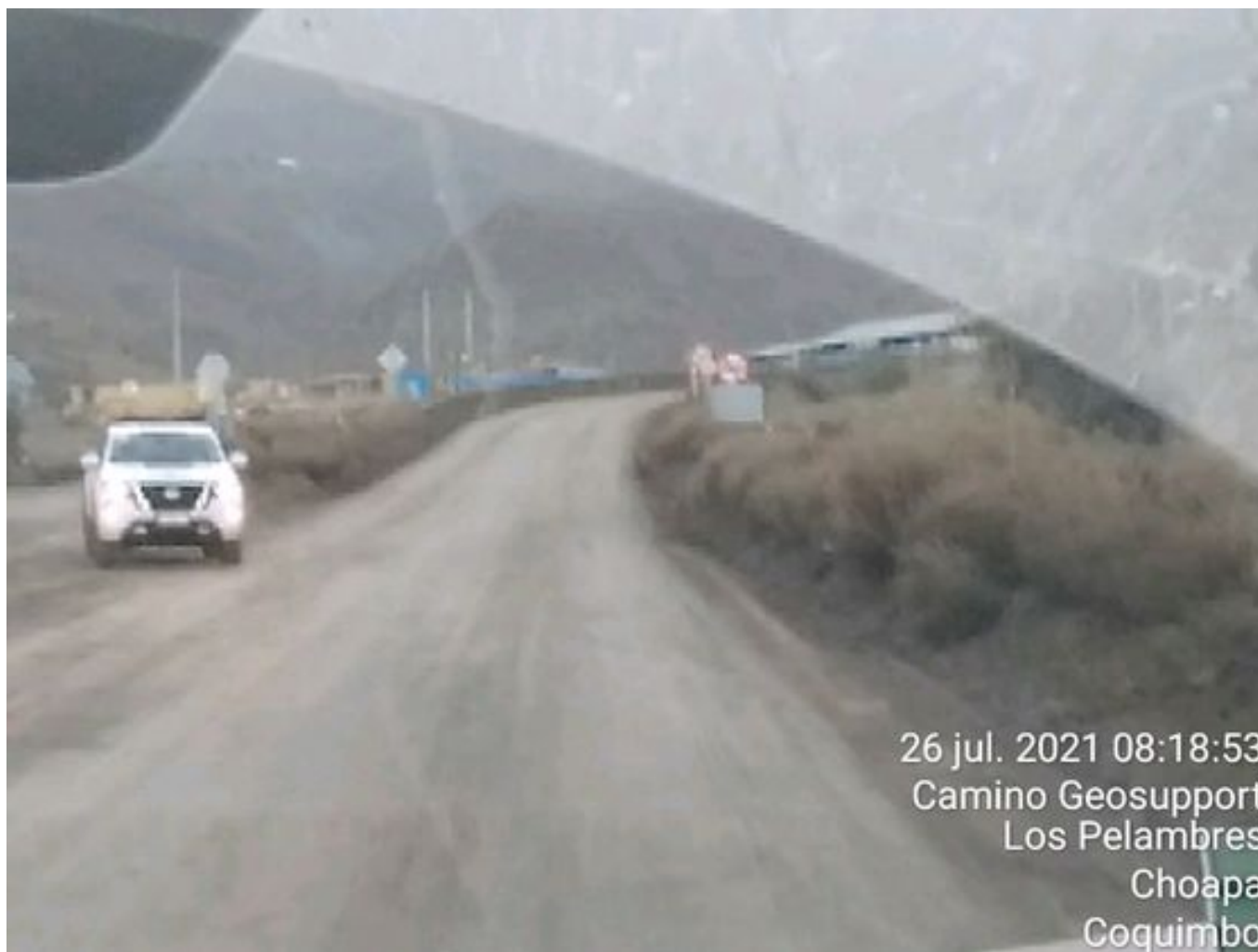
Foto 28: Medida: Aplicación Dust Control. Lugar: Chacay a Quillay. Comentarios: Se observa camino con aplicación de producto entre cortado operativo.