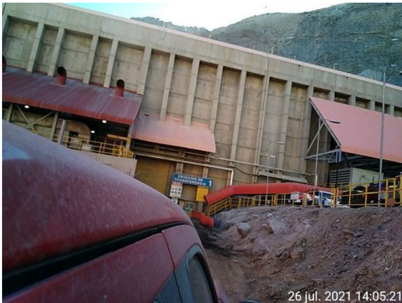
Foto 20: Medida: Regaderas. Lugar: TP1. Comentarios: Detenido por falta de mineral en proceso.