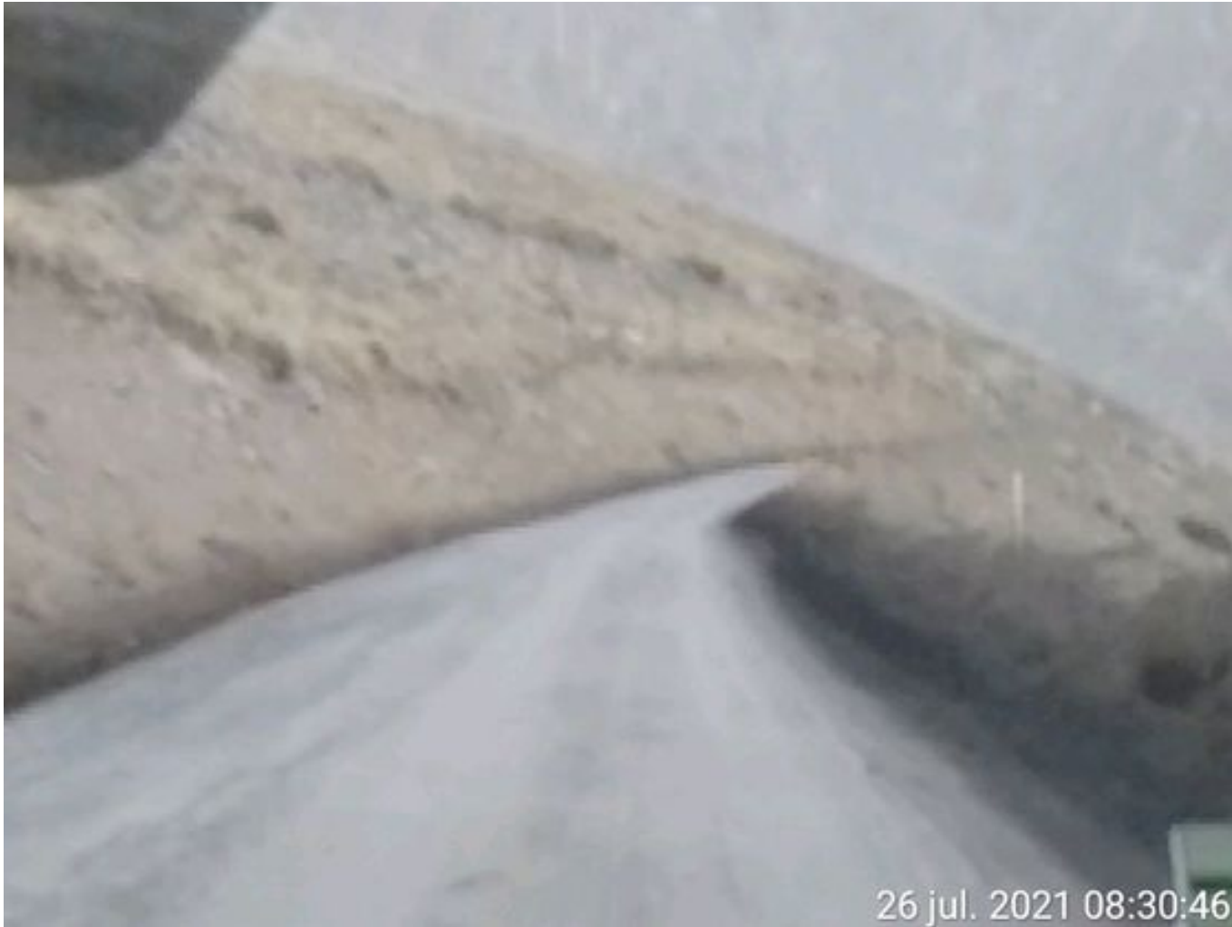
Foto 26: Medida: Aplicación Dust Control. Lugar: Quillay a Hotel Mina. Comentarios: Se observa camino con aplicación de producto entre cortado operativo.