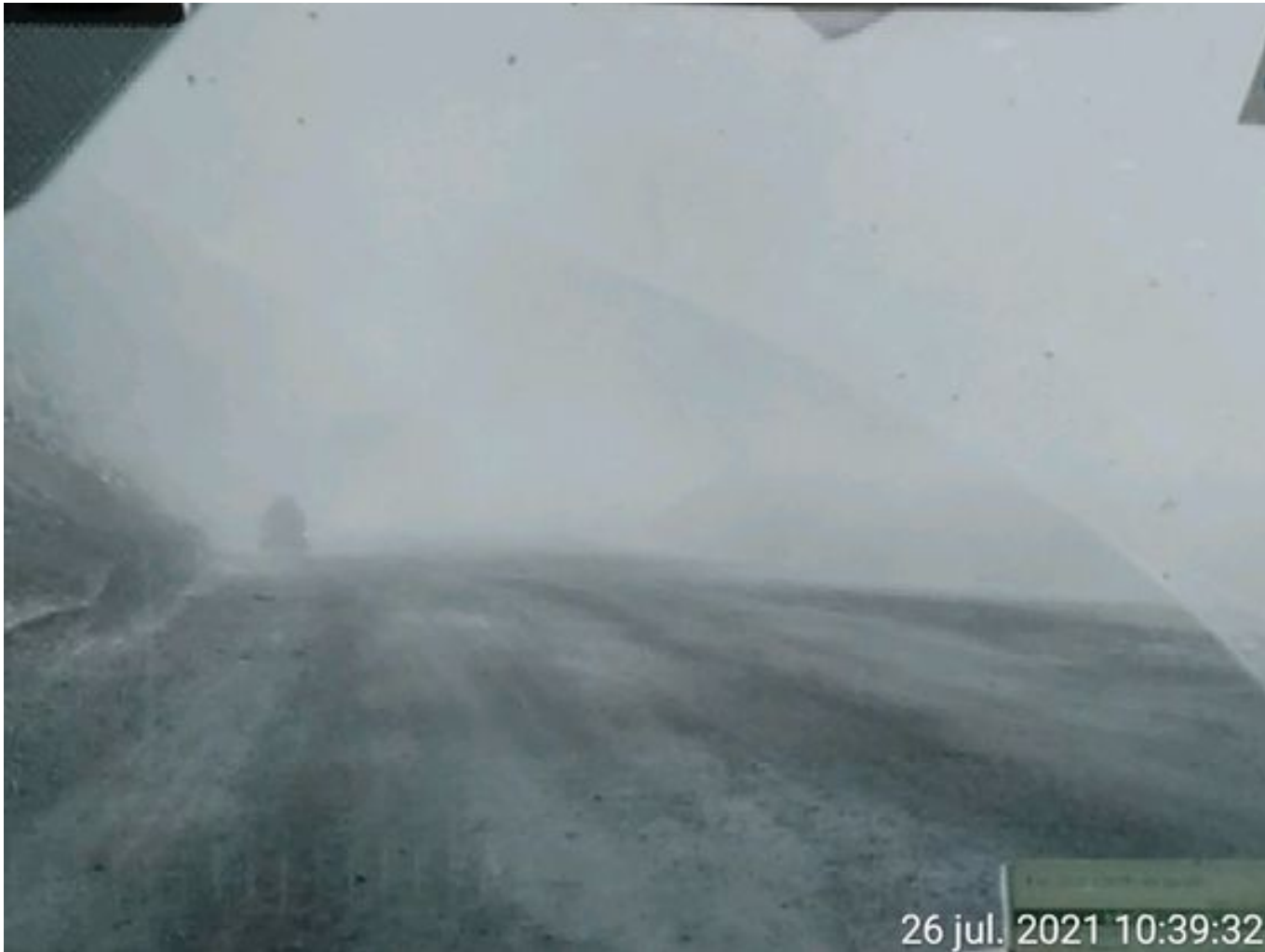
Foto 1: Medida: Riego de caminos. Lugar: Fases Intermedias. Comentarios: Se observa rampas humectadas, cuesta regular regadío debido a congelamiento por bajas temperaturas. 2 aljibes besalco operativos. Fuente de emisión fase 10 por tránsito de Caex.