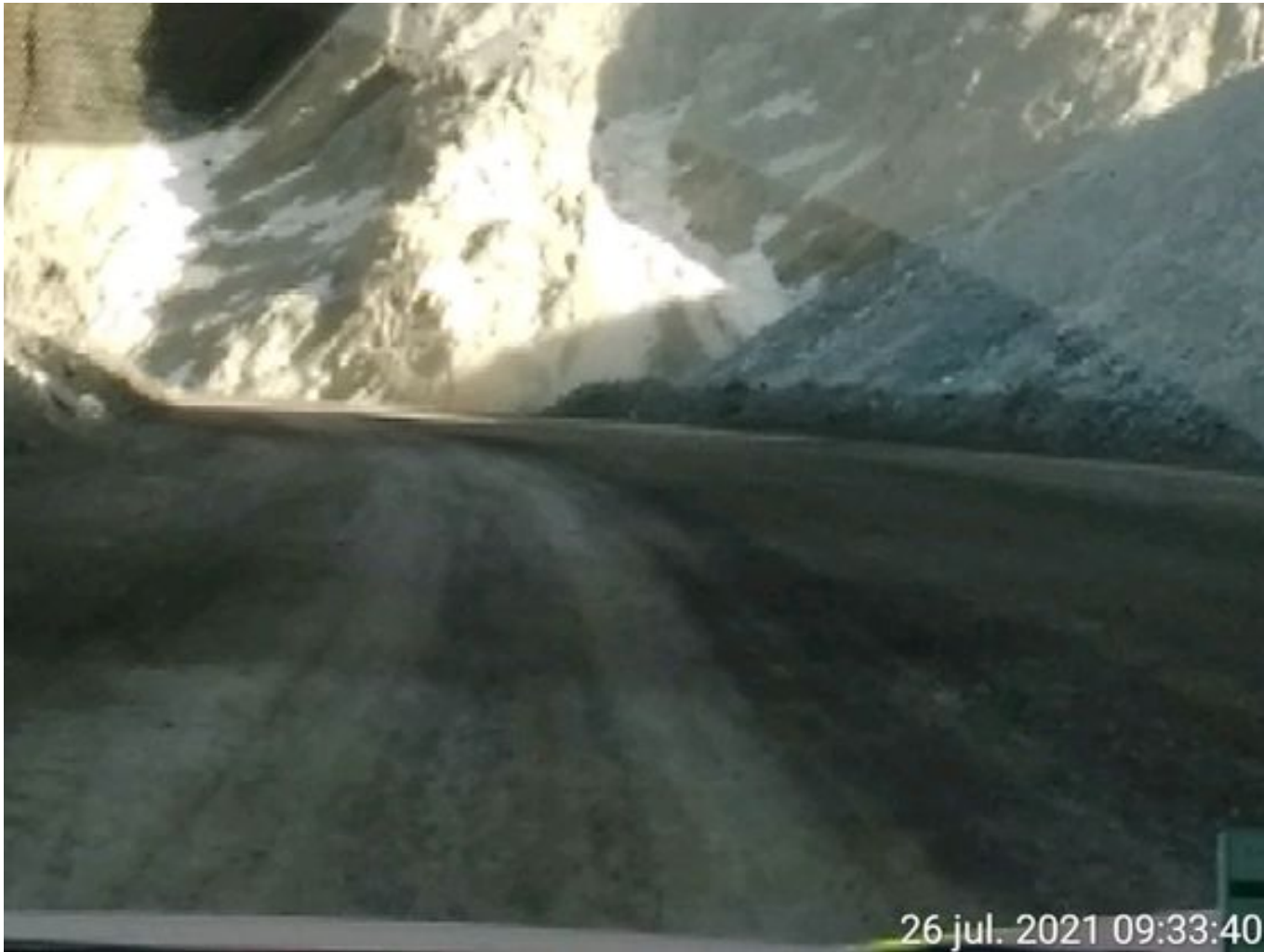
Foto 4: Medida: Riego de caminos. Lugar: Fases Inferiores. Comentarios: Se observa rampas con aplicación de producto entre cortado operativo, 3 aljibes DAS operativos.