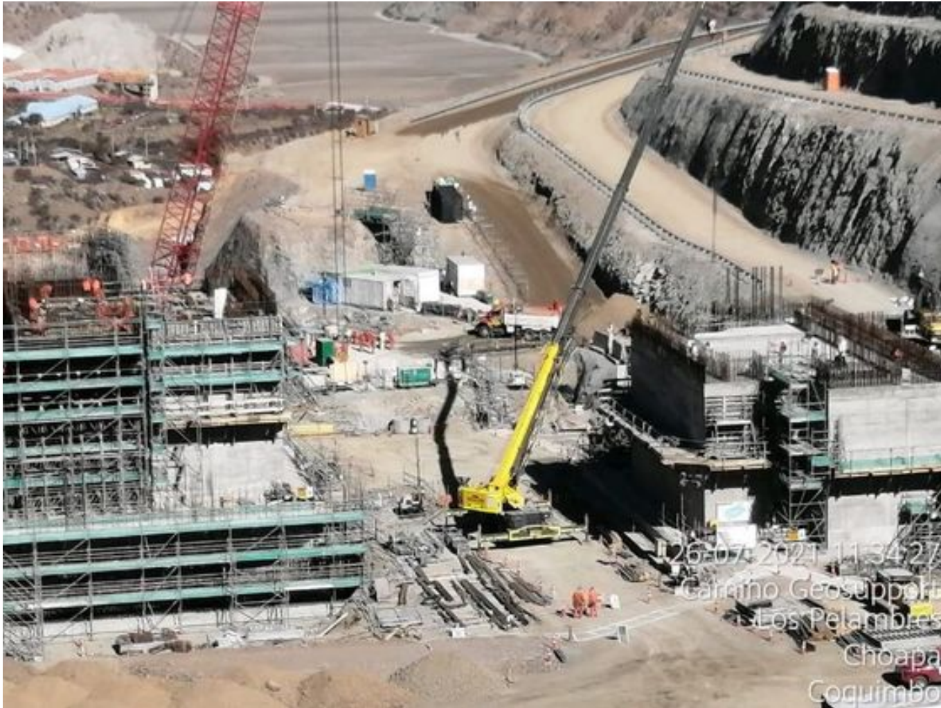
Foto 40: Medida: Riego de frentes de carguio. Lugar: INCO. Comentarios: No se observan trabajos de carguío ni trabajos.