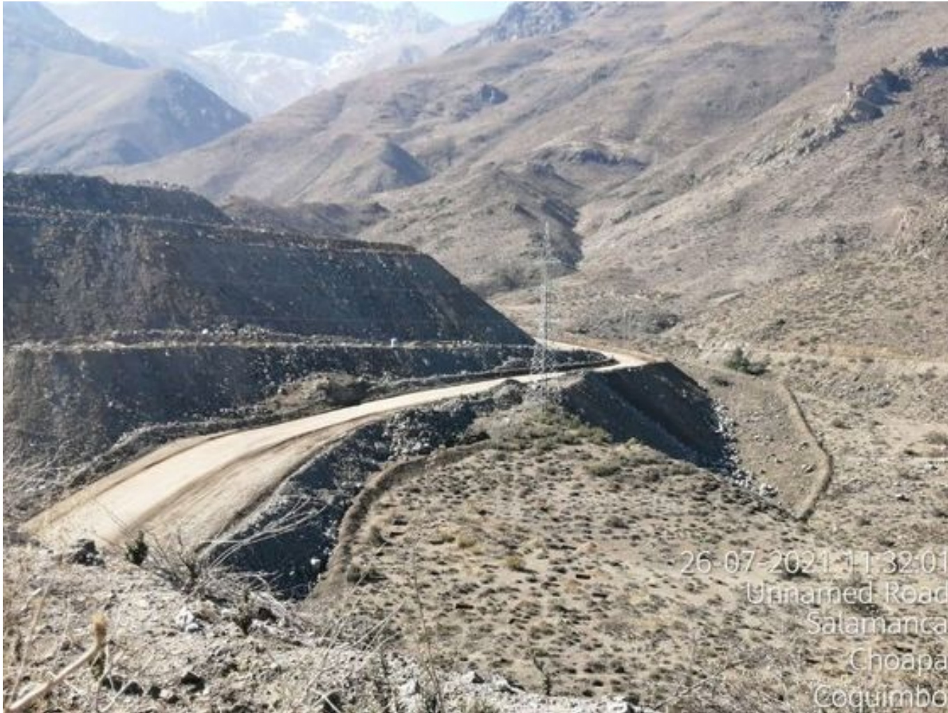
Foto 42: Medida: Riego de caminos en frentes de trabajo. Lugar: INCO. Comentarios: Se observan rampas humectadas por aljibe bechtel.