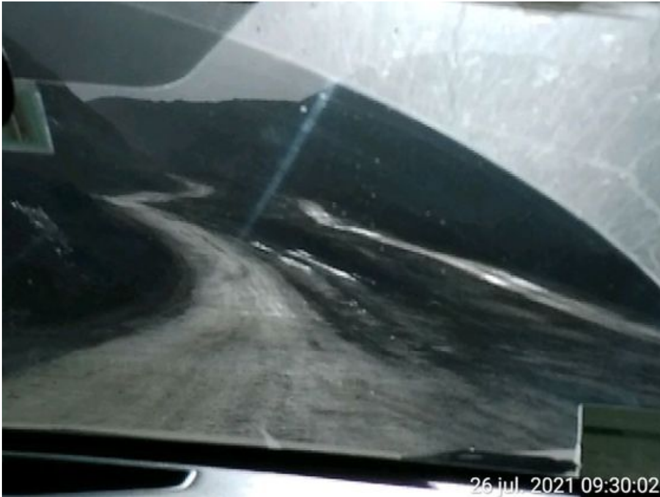
Foto 3: Medida: Riego de caminos. Lugar: Fases Inferiores. Comentarios: Se observa rampas con aplicación de producto entre cortado operativo, 3 aljibes DAS operativos.