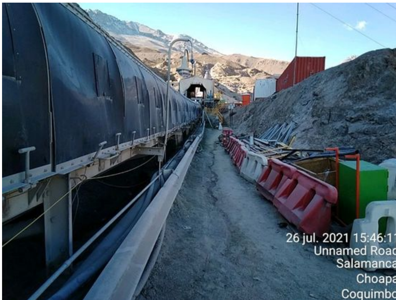
Foto 13: Medida: Limpieza costado Correa CV 007. Lugar: Post-Mantención. Comentarios: Limpieza costado correa operativo, no se observa material particulado en suspensión.