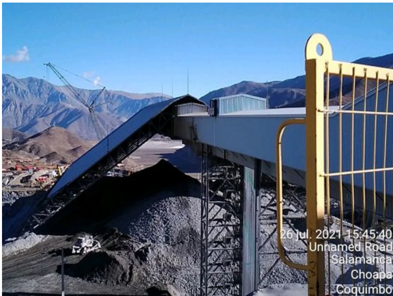
Foto 37: Medida: Regaderas. Lugar: Descarga stock pile planta. Comentarios: No se observan trabajos en el área.