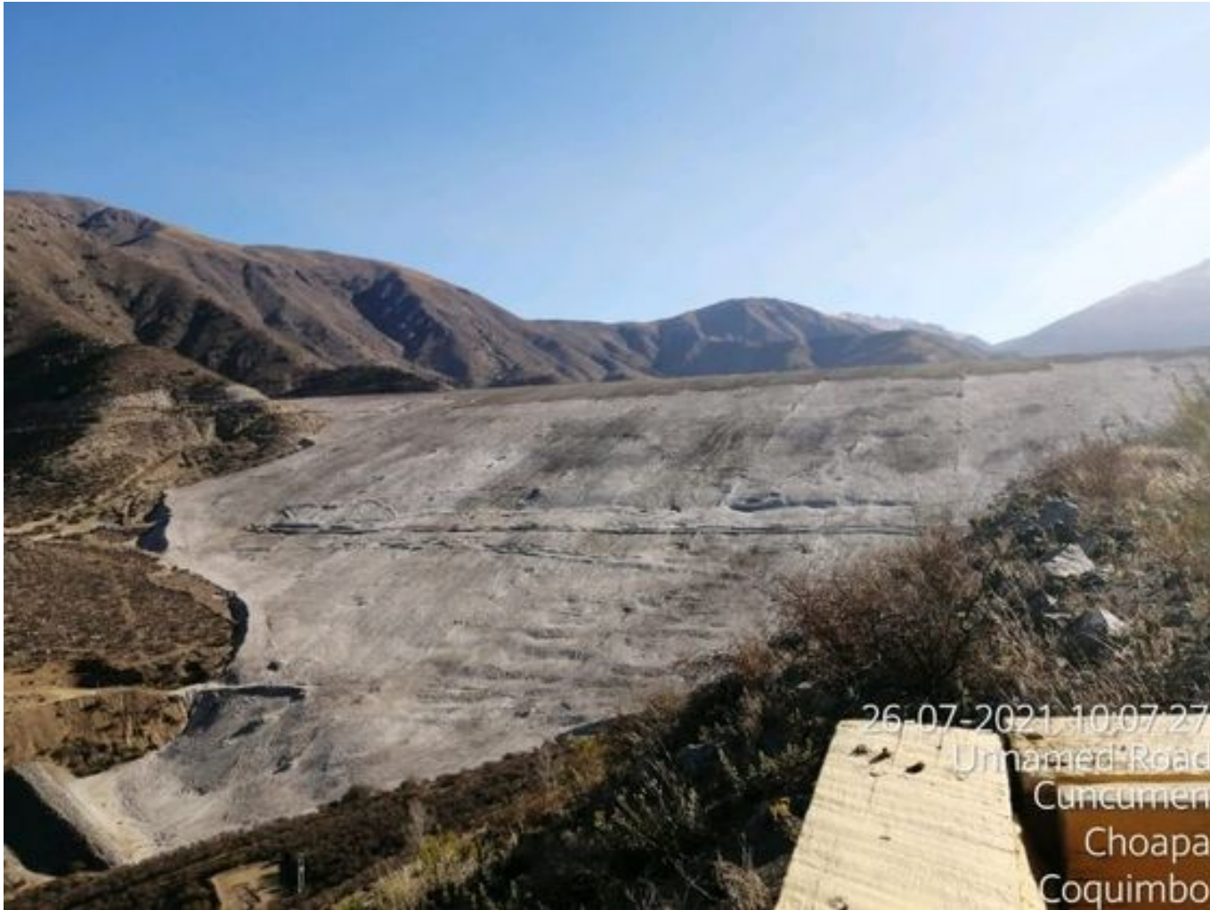
Foto 33: Medida: Aplicación de supresor. Lugar: Sector Muro. Comentarios: No se observan trabajos en el área.