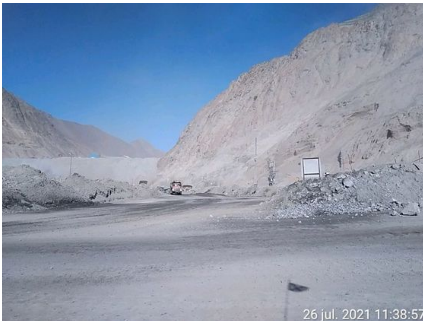
Foto 2: Medida: Riego de caminos. Lugar: Fases Intermedias. Comentarios: Se observa rampas humectadas, cuesta regular regadío debido a congelamiento por bajas temperaturas. 2 aljibes besalco operativos. Fuente de emisión fase 10 por tránsito de Caex.