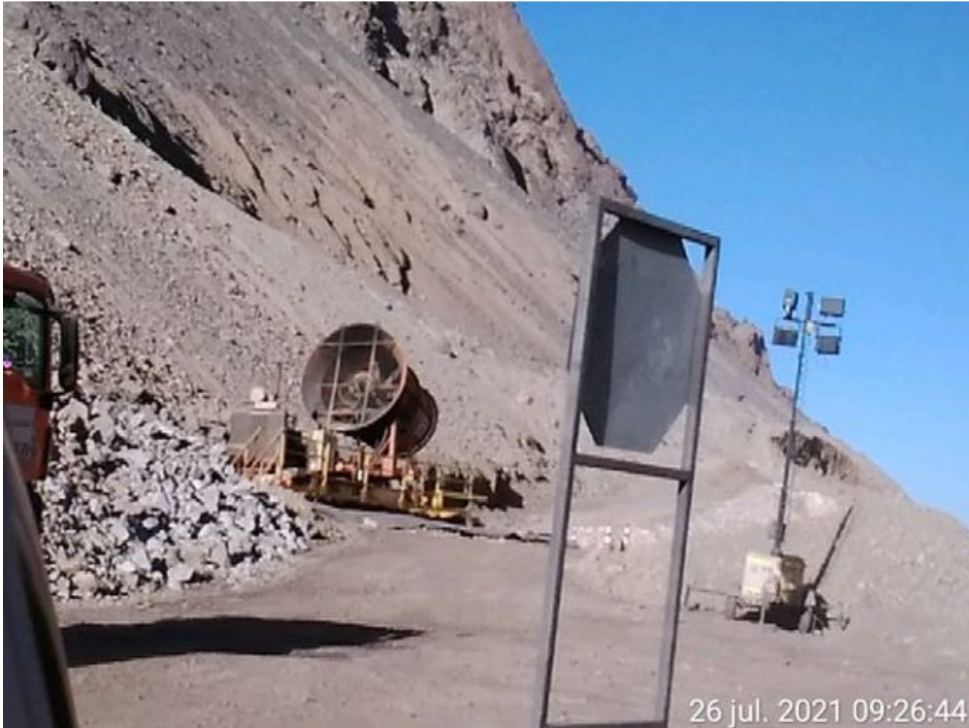
Foto 11: Medida: Fogcannon 2. Lugar: . Comentarios: Fogcannon en reserva por procedimiento. Medida insuficiente para mitigar material particulado en suspensión.