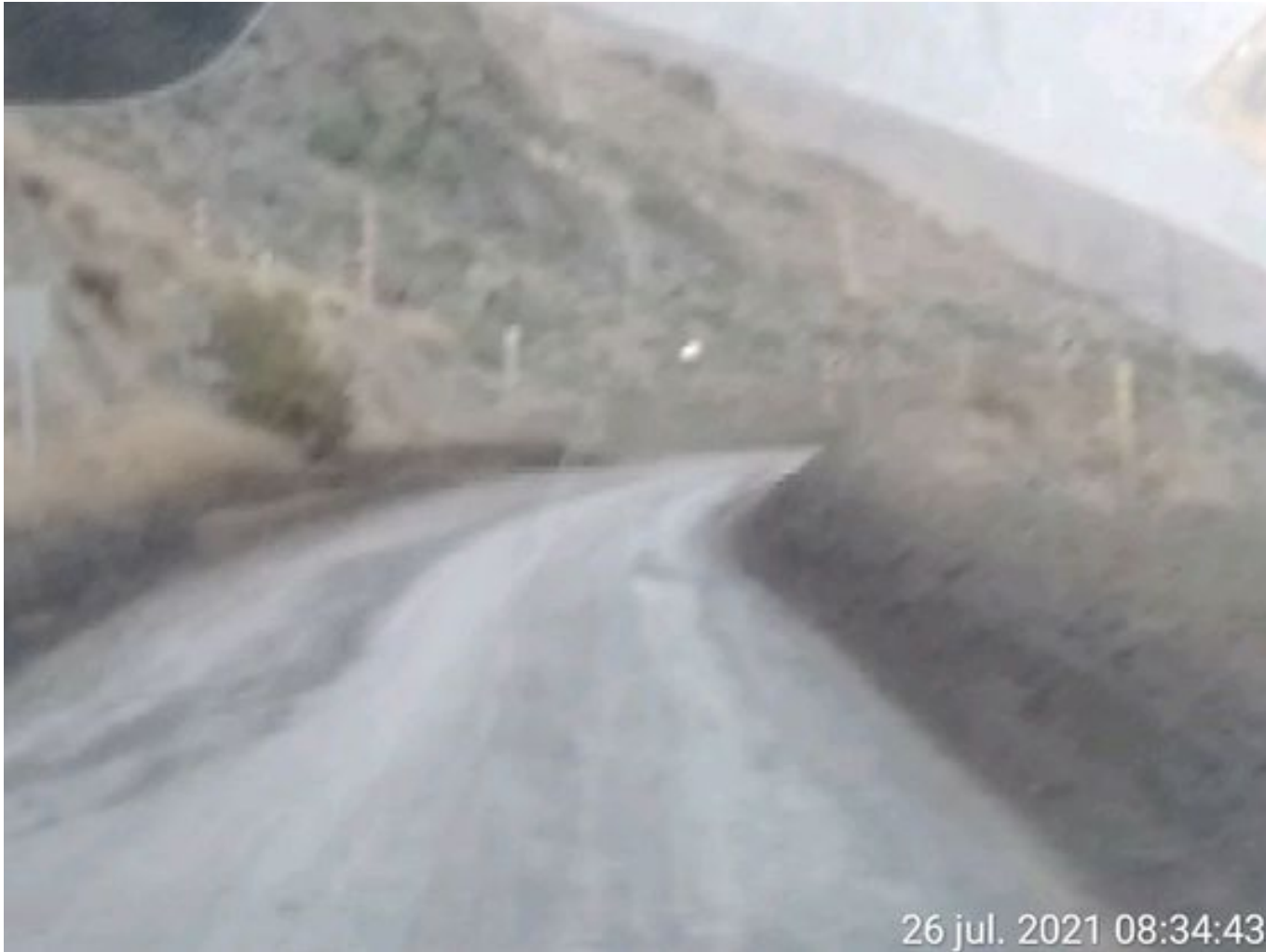
Foto 27: Medida: Aplicación Dust Control. Lugar: Quillay a Hotel Mina. Comentarios: Se observa camino con aplicación de producto entre cortado operativo.