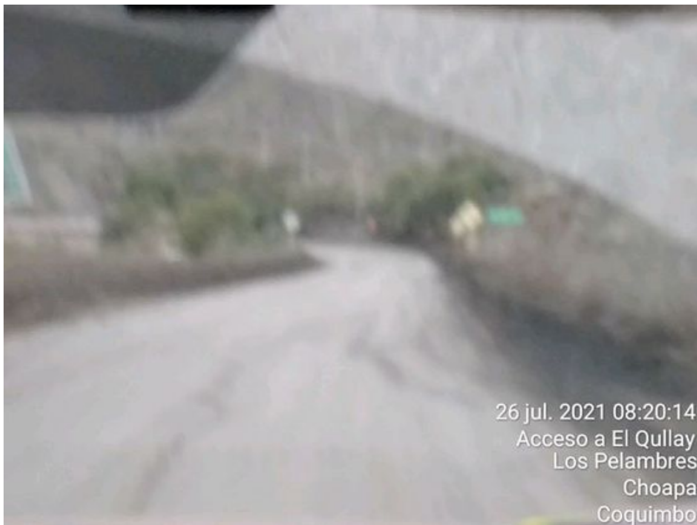
Foto 29: Medida: Aplicación Dust Control. Lugar: Chacay a Quillay. Comentarios: Se observa camino con aplicación de producto entre cortado operativo.