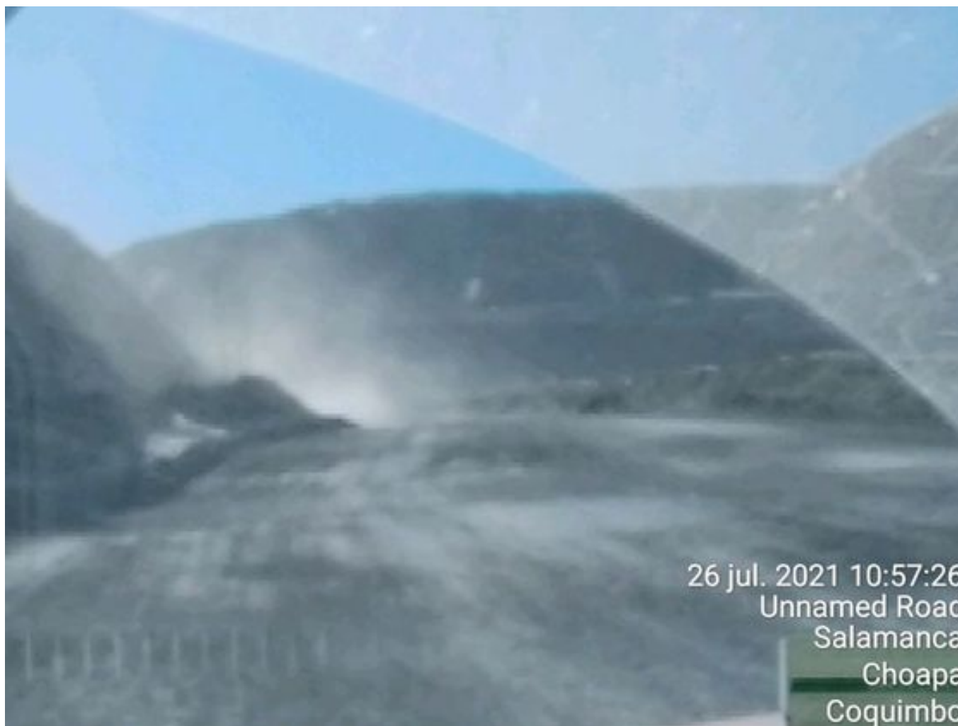
Foto 6: Medida: Riego de caminos. Lugar: Fases superiores. Comentarios: Se observa rampas humectadas, cuesta regular regadío debido a las bajas temperaturas. 3 aljibes besalco operativos. Se observa desprendimiento de material en rampa Este.