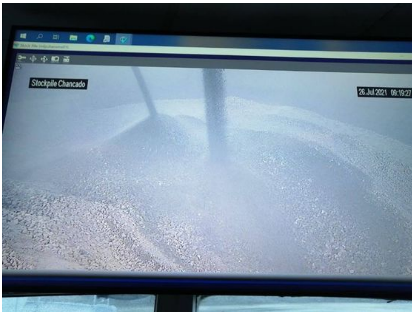
Foto 21: Medida: Espumante en Correas y Stock Pile. Lugar: Chancado 2. Comentarios: Producto operativo, medida insuficiente para mitigar material particulado en suspensión. TK: 4.160L. Bombas al 20% ambos chancados.