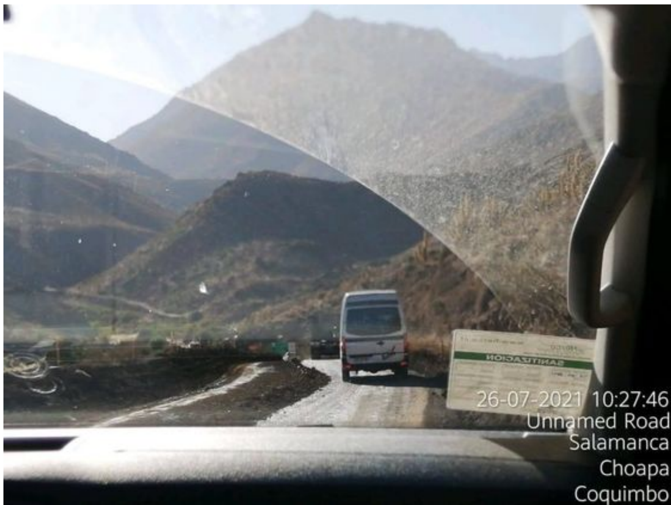
Foto 31: Medida: Aplicación Dust Control. Lugar: Portones a Chacay. Comentarios: Se observa camino con aplicación de producto entre cortado operativo.