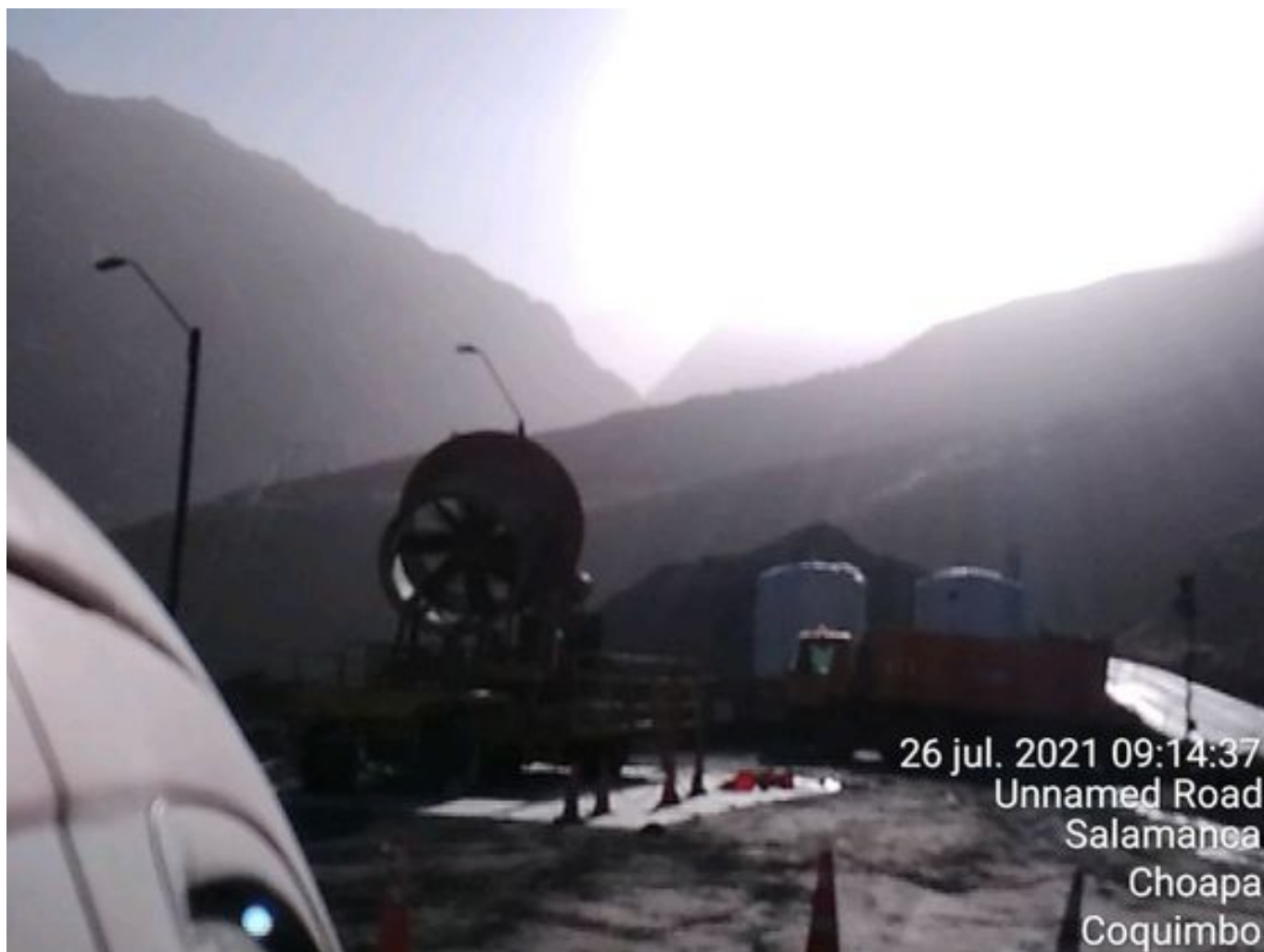
Foto 7: Medida: Fogcannon 1. Lugar: . Comentarios: Fogcannon en reserva por procedimiento. Medida insuficiente para mitigar material particulado en suspensión.