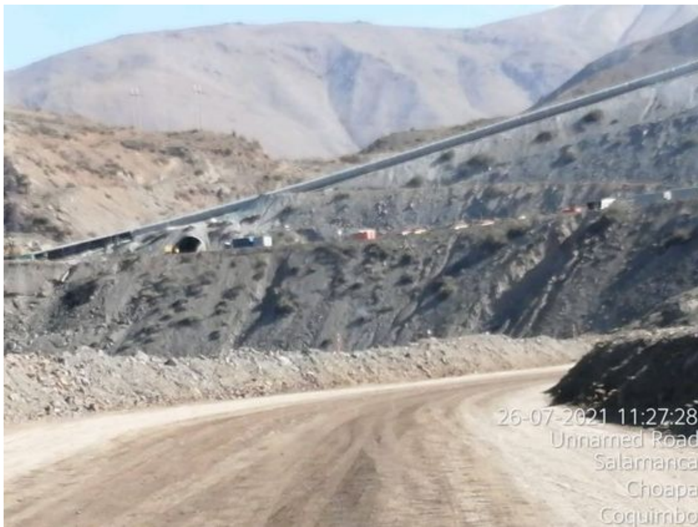
Foto 41: Medida: Riego de caminos en frentes de trabajo. Lugar: INCO. Comentarios: Se observan rampas humectadas por aljibe bechtel.