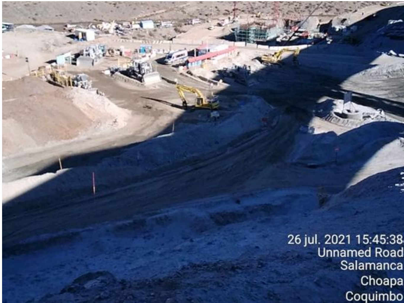
Foto 38: Medida: Riego Caminos. Lugar: Stock pile planta. Comentarios: Se observa camino hacia patio 9 humectado por aljibe bechtel.