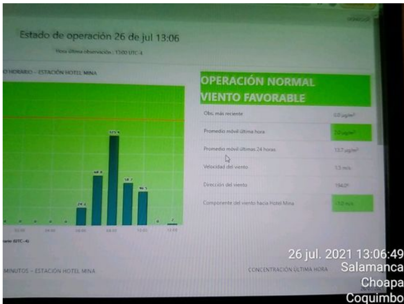
Foto 43: Medida: Paralización de equipos de carguío. Lugar: Medida Adicional. Comentarios: No se presenta alerta por lo tanto se realiza operación normal.