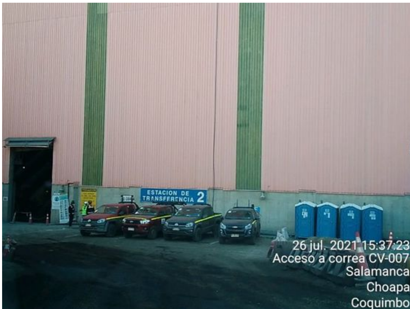
Foto 15: Medida: Regaderas en Correa Transportadora. Lugar: Salida túnel 3. Comentarios: No se observan trabajos en el área.