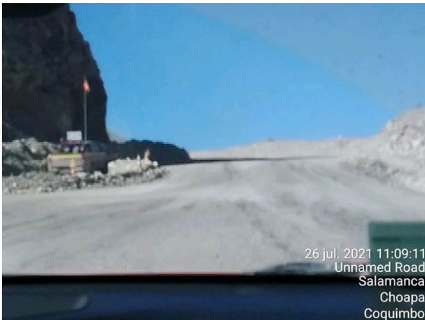
Foto 8: Medida: Riego de caminos EPSA Cerro Amarillo. Lugar: Fases superiores. Comentarios: Se observa circuito epsa Cerro amarillo humectado, cuesta regular el regadío debido a congelamiento por bajas temperaturas. Aljibe epsa operativo.