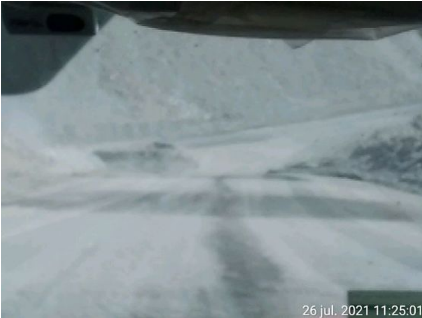
Foto 9: Medida: Riego de caminos EPSA Cerro Amarillo. Lugar: Fases superiores. Comentarios: Se observa circuito epsa Cerro amarillo humectado, cuesta regular el regadío debido a congelamiento por bajas temperaturas. Aljibe epsa operativo.