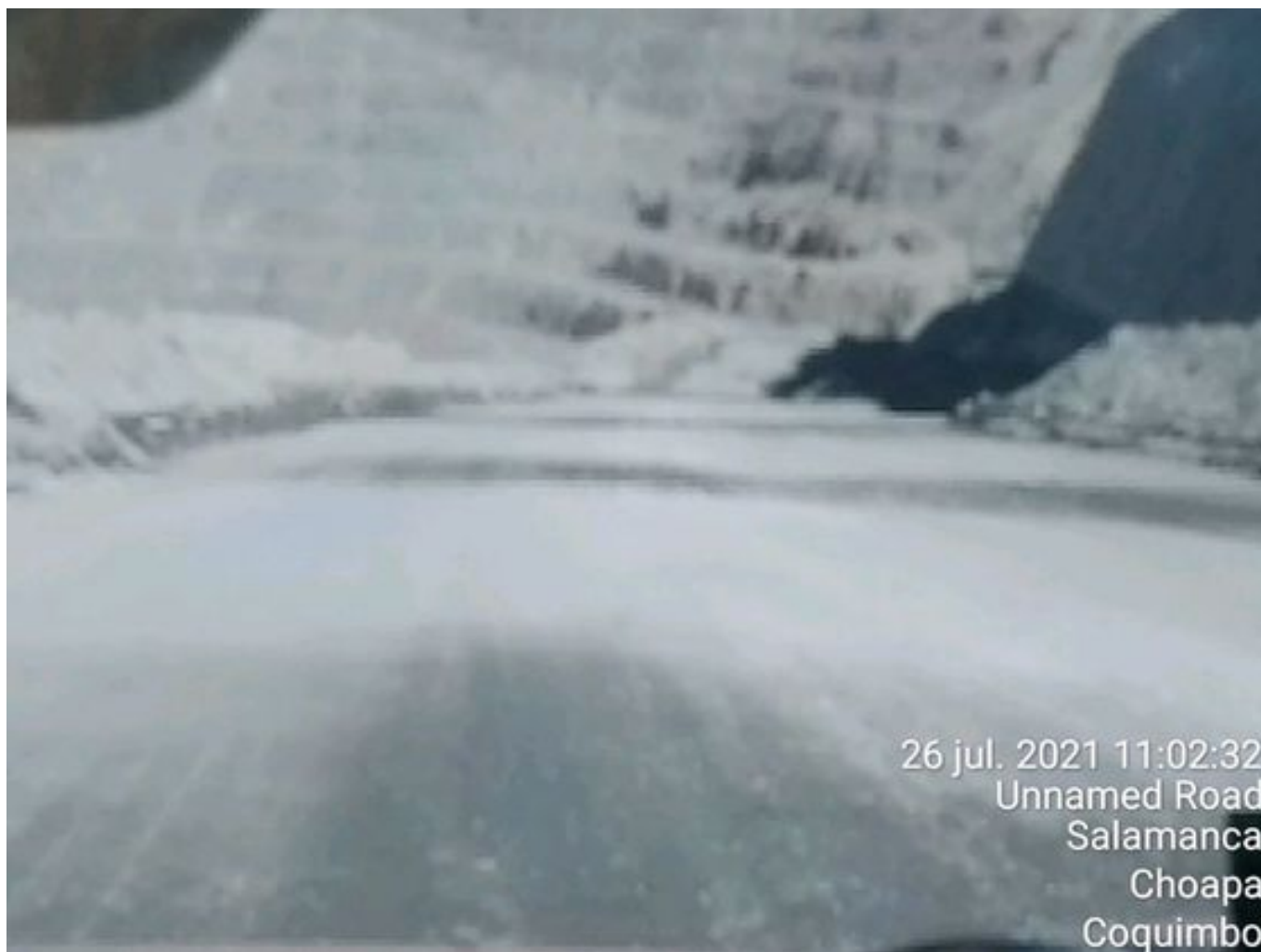
Foto 5: Medida: Riego de caminos. Lugar: Fases superiores. Comentarios: Se observa rampas humectadas, cuesta regular regadío debido a las bajas temperaturas. 3 aljibes besalco operativos. Se observa desprendimiento de material en rampa Este.