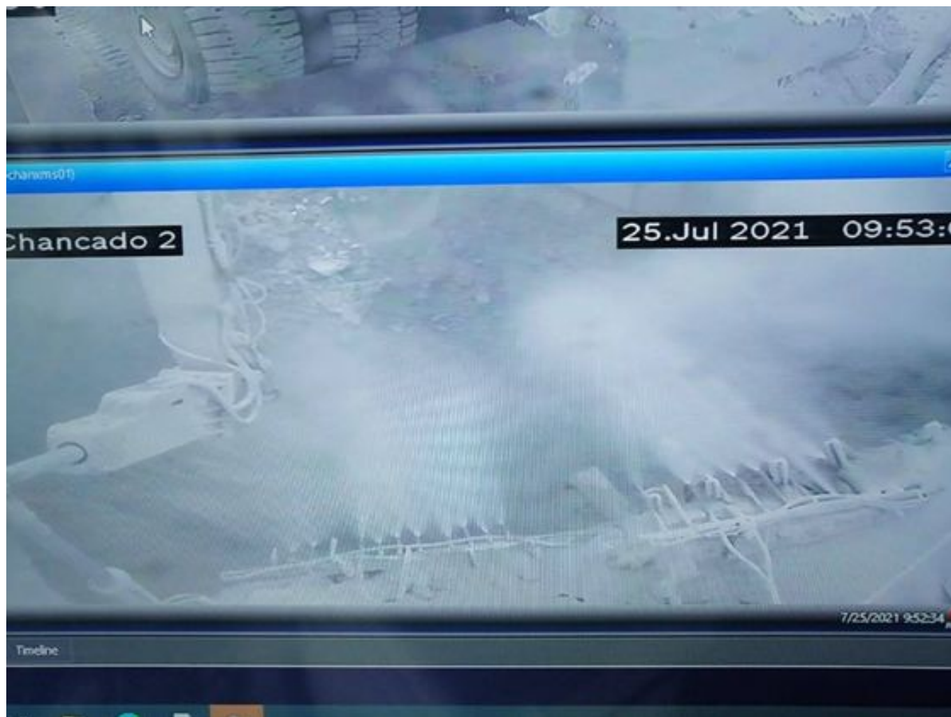
Foto 17: Medida: Supresor de polvo. Lugar: Taza Chancado 2. Comentarios: Supresores de polvo operativos funcionando al 75% debido a congelamientos durante turno noche, medida insuficiente para mitigar material particulado en suspensión. TK: 4.160L. Bombas al 20% ambos chancados.