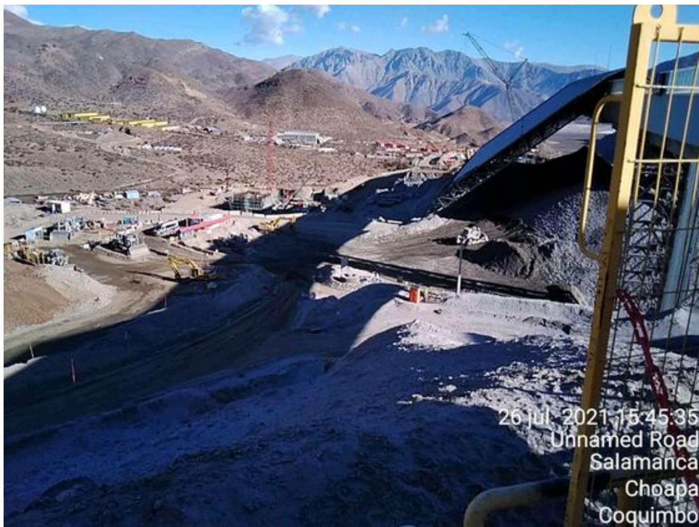
Foto 39: Medida: Riego Caminos. Lugar: Stock pile planta. Comentarios: Se observa camino hacia patio 9 humectado por aljibe bechtel.