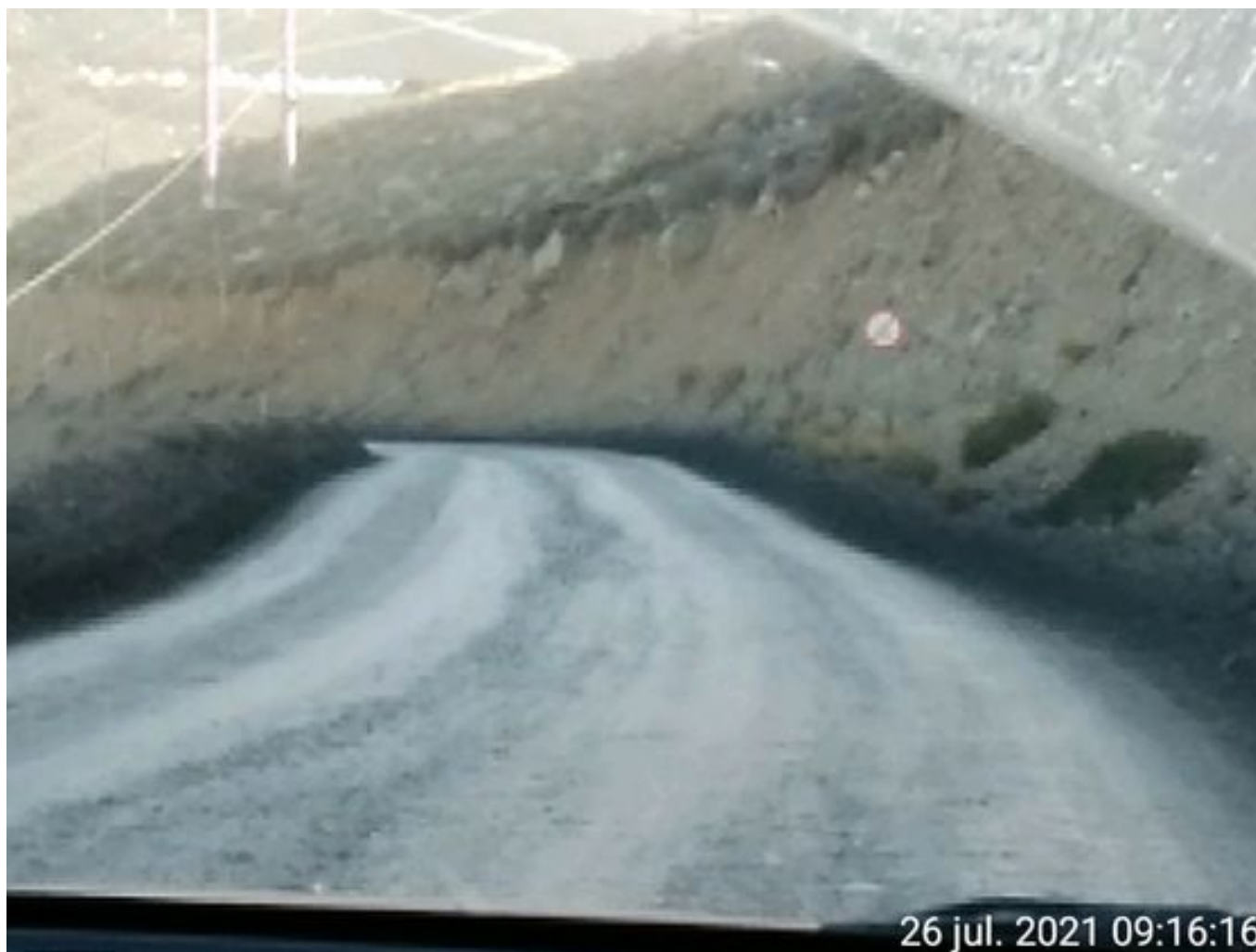
Foto 24: Medida: Aplicación de producto Corp. Vial. Lugar: Hotel Mina a Garita Mina. Comentarios: Se observa camino con aplicación de producto entre cortado operativo.