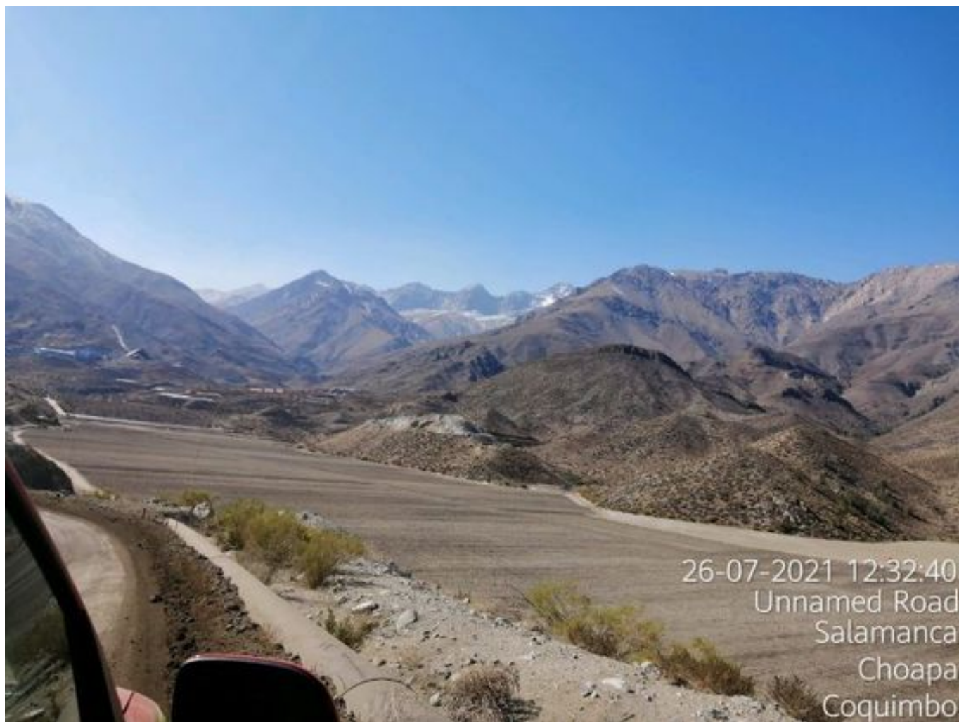
Foto 36: Medida: Aplicación de empréstito. Lugar: Sector Cola. Comentarios: No se observan trabajos en el área.