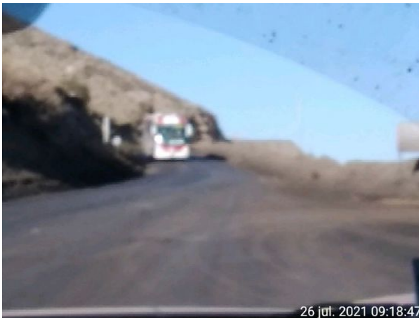
Foto 25: Medida: Aplicación de producto Corp. Vial. Lugar: Hotel Mina a Garita Mina. Comentarios: Se observa camino con aplicación de producto entre cortado operativo.